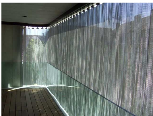
Materiaal: CHARLIE BRAVO zon- en warmtewerend gordijn