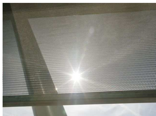
GOLF SIERRA als zonnewerend paneel